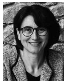
Olivier KLEIN Ministre délégué de la Ville et du Logement